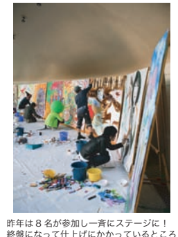
昨年は8名が参加し一斉にステージに! 終盤になって仕上げにかかっているところ

【一般参加について】ライブペイントについてはアートマーケット登録者の推薦がある方もしくは井の頭公園の周辺地域(武蔵野市・三鷹市など)にご在住の方にもご参加いただけます。