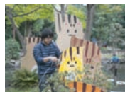
昨年の「りす島」の準備の様子

テーマにそぐうものであれば立体、平面、アイデア、材料など自由です。個人個人で作る、又はみんなで大きなものを作る、など応募者さんの中で相談しながら作っていきたく思います。