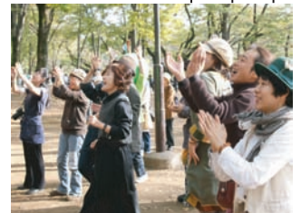
みんな思い思いに手拍子したり かけ声をかけたり とんだりはねたりして楽しみます