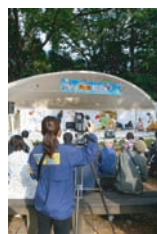
武蔵野三鷹ケーブルテレビ さんの取材の様子