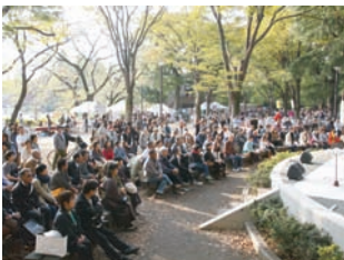
ライブペイントが始まるとうっとり絵も音楽と一緒に 楽しもうとお客さんがベンチに腰掛けはじめます!

または三鷹市観光情報スポット「風のえき」(公園近くのカフェ)さん店頭配布チラシにて